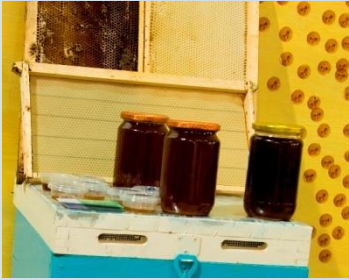
Μέλι Καρύστου (ερεικόμελο)

ή από μια άτυπη/ανεπίσημη ιδιοτυπία γι' αυτό και θεωρούνται ως «αγνά», «αυθεντικά» ή «παραδοσιακά» από τους κατοίκους και τους επισκέπτες της περιοχής