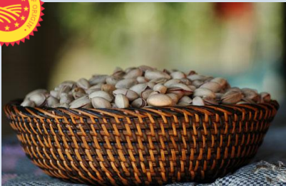
Κελυρωτό Φιστίκι Φθιώτιδας