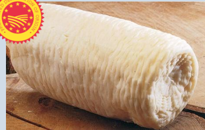
Φορμαέλα Αράχωβας Παρνασού