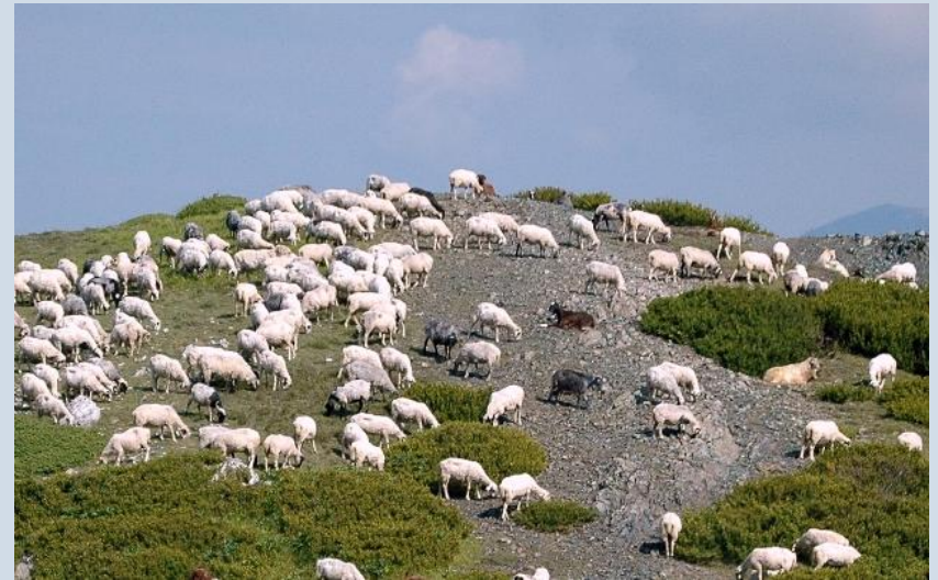
Κατσικάκι και αρνάκι εκτατικής & ορεινής κτηνοτροφίας