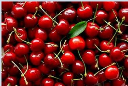
Κεράσι Μετοχίου Διρφύων Κεράσι Γοργοποτάμου