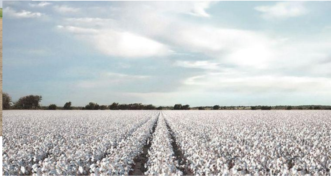
Αγρός σποροπαραγωγής βαμβακιού