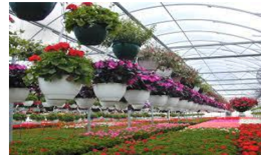
Ανθοκομικά - Καλλωπιστικά