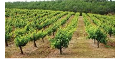
Αμπέλι - Δενδρώδη