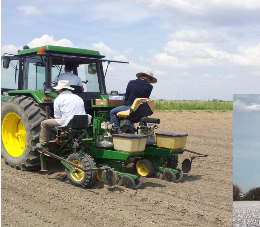
Σπορά αγρού διατήρησης