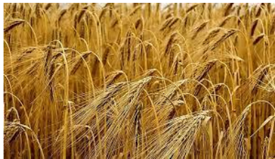
Φυτά Μεγάλης Καλλιέργειας

Ο ΣΕΠΥ είναι η «φωνή» της Ελληνικής Βιομηχανίας Πολλαπλασιαστικού Υλικού με μέλη που δραστηριοποιούνται στην παραγωγή και εμπορία Π.Υ.