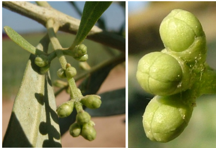
στάδιο Ε Διαφοροποίηση στεφάνης