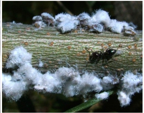
ΒΑΜΒΑΚΑΔΑ ( Euphyllura phillyreae )