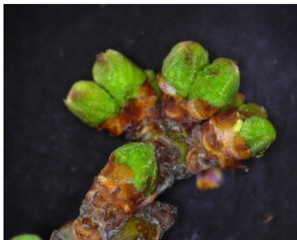
Πράσινη κορυφή Δαμασκηιά στάδιο C