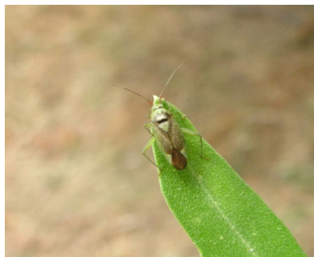
ΚΑΛΟΚΟΡΗ ( Calocoris trivialis )