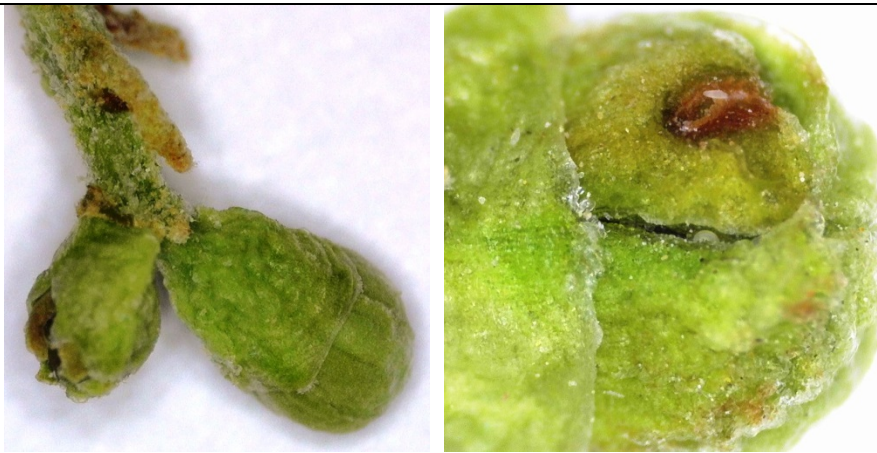
προσβολή και βλάβη από ακάρεα Eriophyidae