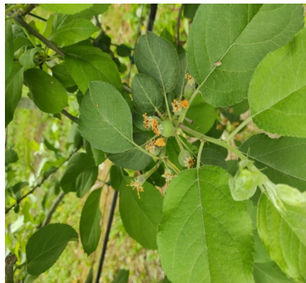
Η πλήρης πτώση πετάλων

Συνιστάται εβδομαδιαία δειγματοληψία 5 φύλλων/ δέντρο, από 20 σημασμένα δέντρα. Εάν καταμετρηθούν περισσότερα από 20 ακάρεα/φύλλο να γίνει επέμβαση μετά την πτώση των πετάλων με εγκεκριμένα ακαρεοκτόνα σκευάσματα.