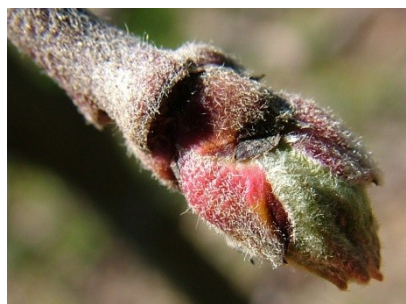
C Πράσινη κορυφή