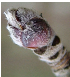
B Φούσκωμα οφθαλμών, διαχωρισμός λεπιών