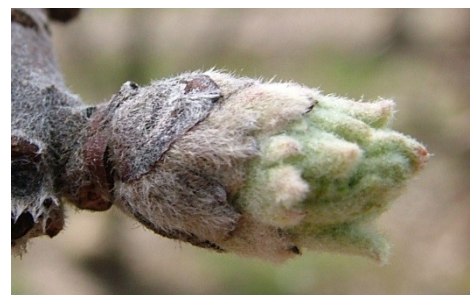
C 3 "αυτιά ποντικού" πράσινες κορυφές φύλλων εξέχουν από τα λέπια