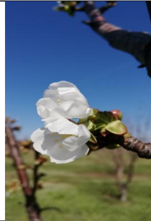
Λευκή κορυφή – Έναρξη άνθησης