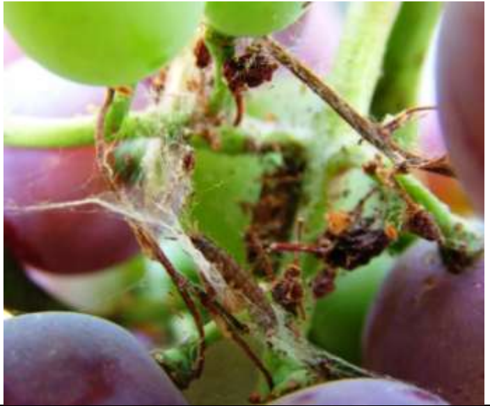
Εικόνα 2. Αυγά και προνυμφική δραστηριότητα Ευδεμίδας