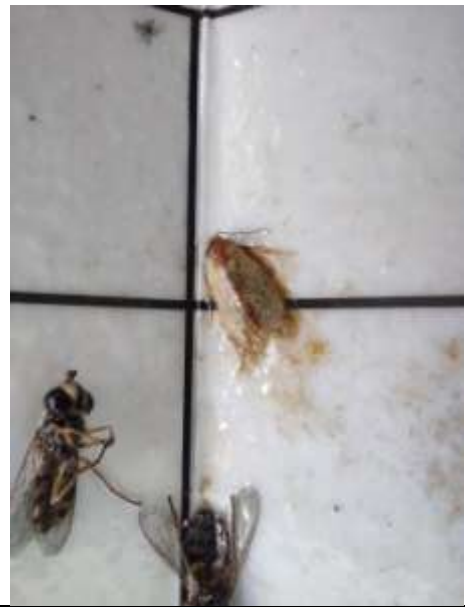
Εικόνα 1. Lobesia botrana