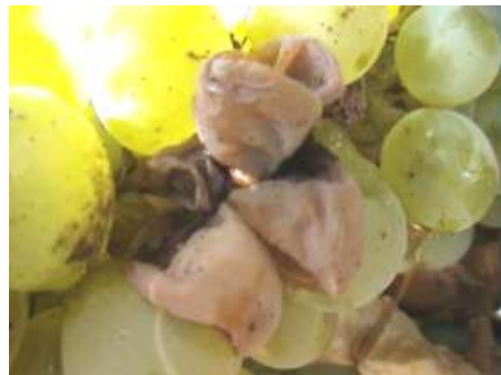
Εικόνα 1. Άμεση βλάβη των ραγών από Ευδεμίδα και έμμεση βλάβη από Βοτρώτη