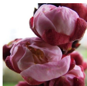
E Εμφάνιση στημόνων