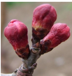
C Εμφάνιση κάλυκα