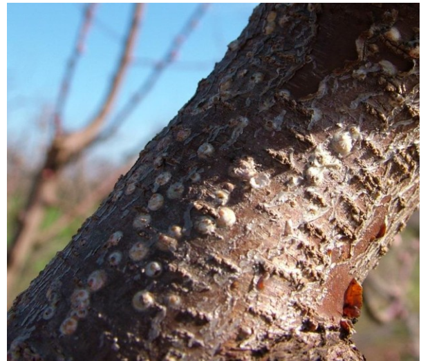
Παρουσία ασπιδίων βαμβακάδας στο 25%