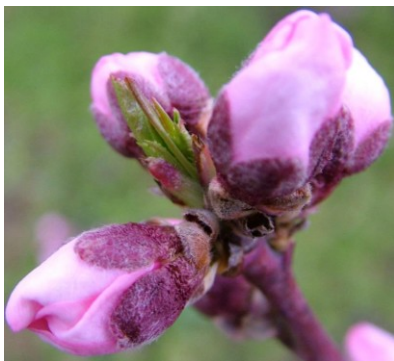
D Εμφάνιση στεφάνης