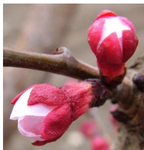
D Εμφάνιση στεφάνης