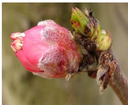
E Εμφάνιση στημόνων