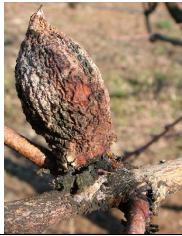
Προσβολή από Μονίλια