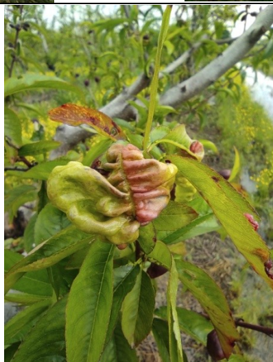
Εξώασκος – Καρούλιασμα φύλλου