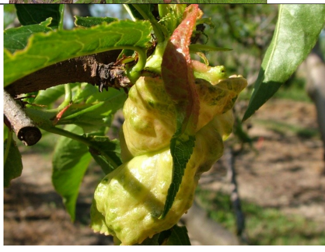
Προσβολή από εξώασκο