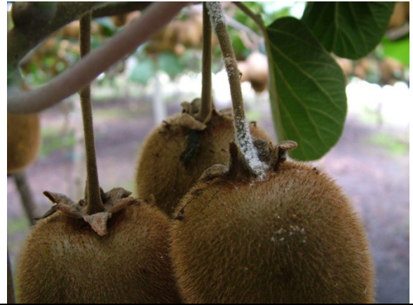
Προσβολή από βαμβακάδα σε Ροδακινιά και Ακτινιδιά