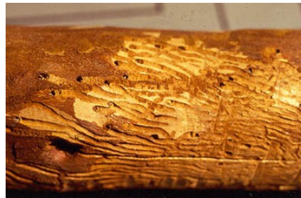
Προσβολή Κερασιάς από σκολύτη