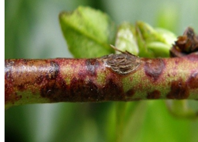
Προσβολή από κορόνιο