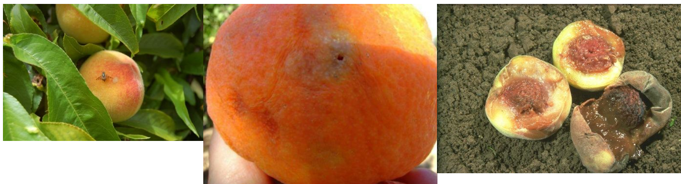
Προσβολή καρπών από Μύγα Μεσογείου

Τα θηλυκά ωτοκοούν ομάδες αυγών στους ώριμους καρπούς όπου η οπή ωτοκίας στην αρχή είναι αδιόρατη. Οι εκκολαπτόμενες προνύμφες τρέφονται με τη σάρκα των καρπών, ενώ η προσβολή συχνά ακολουθείται από δευτερογενείς φυτοπαθολογικές προσβολές που επιτείνουν περαιτέρω την απώλεια παράγωγης. Είναι πολυφάγο είδος. Προσβάλλει την ροδακινιά, αχλαδιά, δαμασκηλιά, συκιά, λωτούς, μηλιά, κυδωνιά, κ.α. Έχει μεγάλη διασπορά και μπορεί να πετάξει σε αποστάσεις εκατοντάδων μέτρων για να βρει κατάλληλο καρπό για ωτοκία.