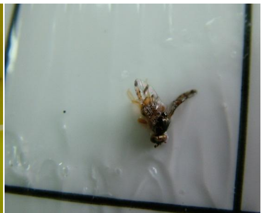
Συλλήψεις ενηλίκων Μύγας Μεσογείου