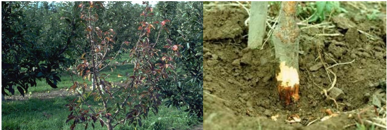
προσβολή Μηλιάς από Phytophthora