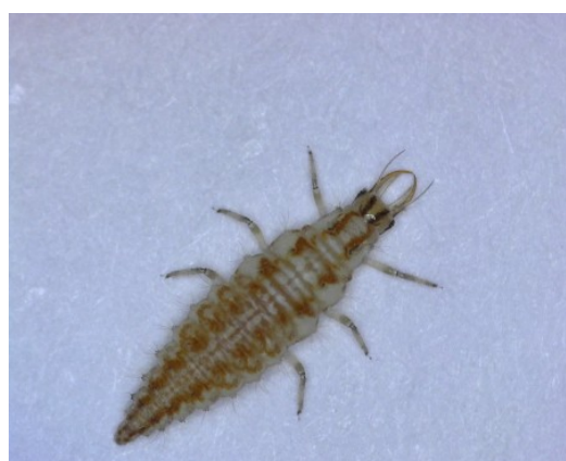
Προνύμφη του γένους Chrysoperla