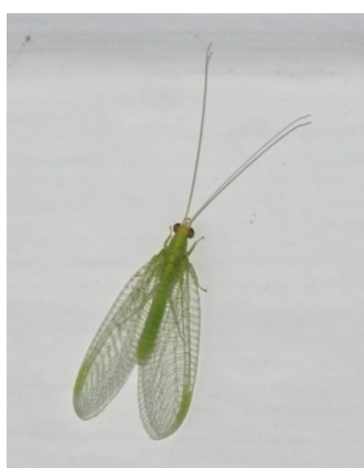
Ενήλικο του γένους Chrysoperla (Οικ.: Chrysopidae)