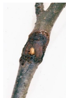
προσβολή Μηλιάς από Nectria galligena