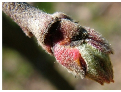
C Πράσινη κορυφή