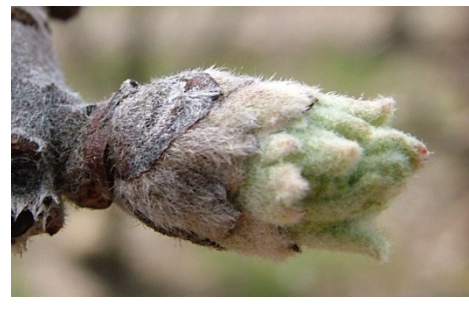
C 3 "αυτιά ποντικού" πράσινες κορυφές φύλλων εξέχουν από τα λέπια