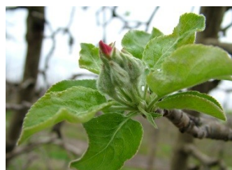
E ρόδινη κορυφή