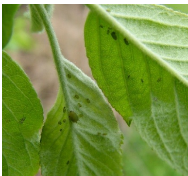
περίπου 15 άτομα πράσινης αφίδας