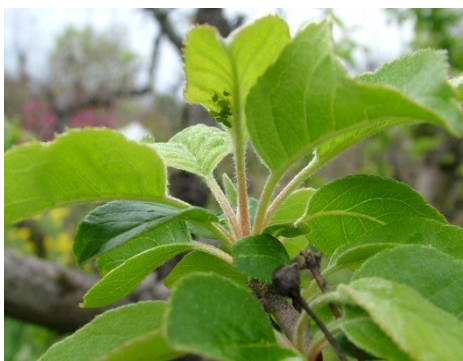
αφίδες στην κάτω επιφάνεια φύλλου

https://1click.minagric.gr/oneClickUI/frmMacroorgHome.zul