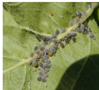
Dysaphis plantaginea ρόδινη αφίδα μηλιάς