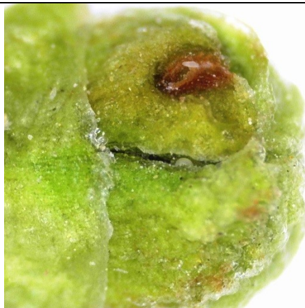
προσβολή και βλάβη από ακάρεα Eriophyidae