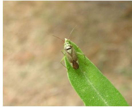
ΚΑΛΟΚΟΡΗ ( Calocoris trivialis )