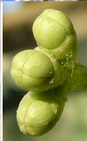
στάδιο Ε Διαφοροποίηση στεφάνης