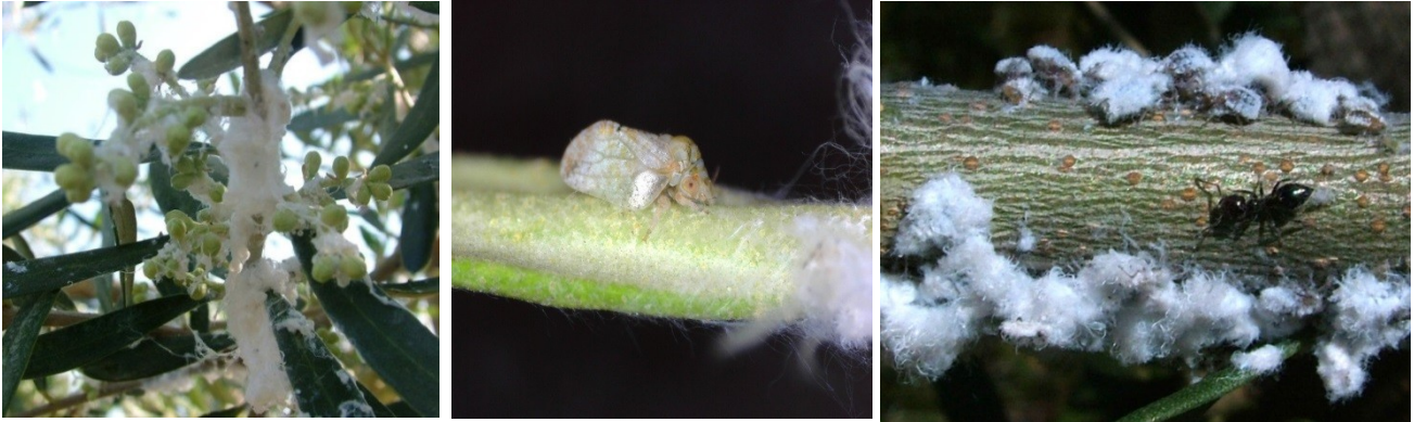
BΑΜΒΑΚΑΔΑ ( Euphyllura phillyreae )