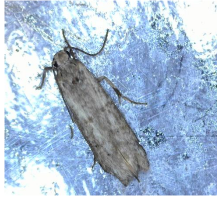
Πυρηνοτρήτης ( Prays oleae )