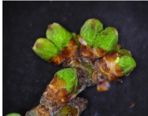
Πράσινη κορυφή Δαμασκηνιά στάδιο C