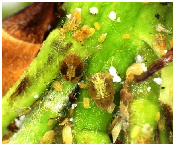
Αυγά και προνύμφες Cacopsylla pyri σε ταξιανθίες