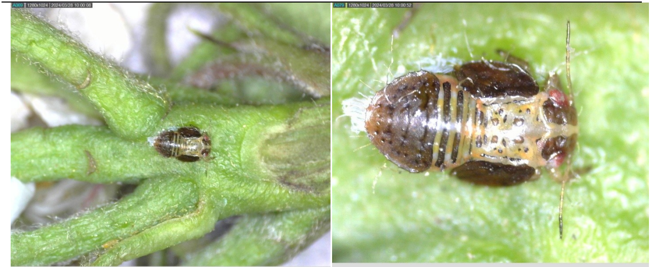
Προνύμφες αρχικών και τελευταίων σταδίων