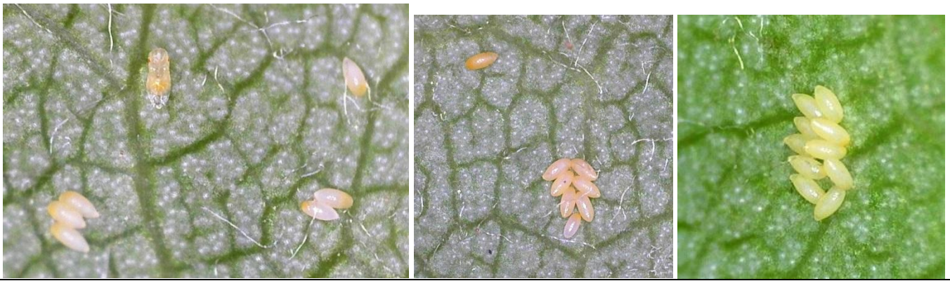
Αυγά νέα-λευκά, αυγά ώριμα-κίτρινα και προνύμφη που εκκολάπτεται όπως φαίνονται από μεγέθυνση