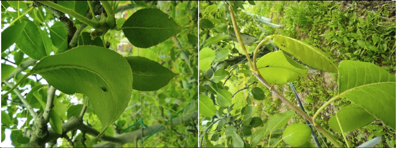
Τέλειο έντομο Cacopsylla pyri της ανοιζιάτικης πτήσης