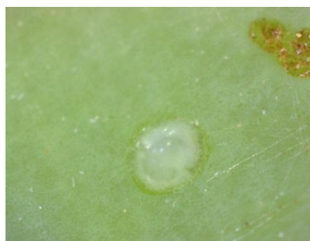
Αυγά και προνυμφική δραστηριότητα Ευδεμίδας