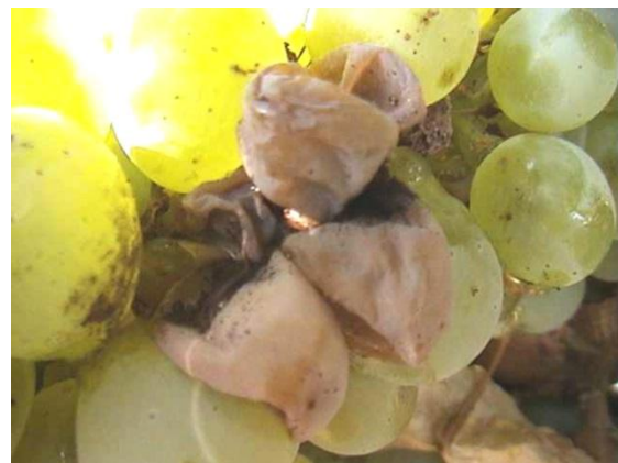
Εικόνα 1. Άμεση βλάβη των ραγών από Ευδεμίδα και έμμεση βλάβη από Βοτρίτη