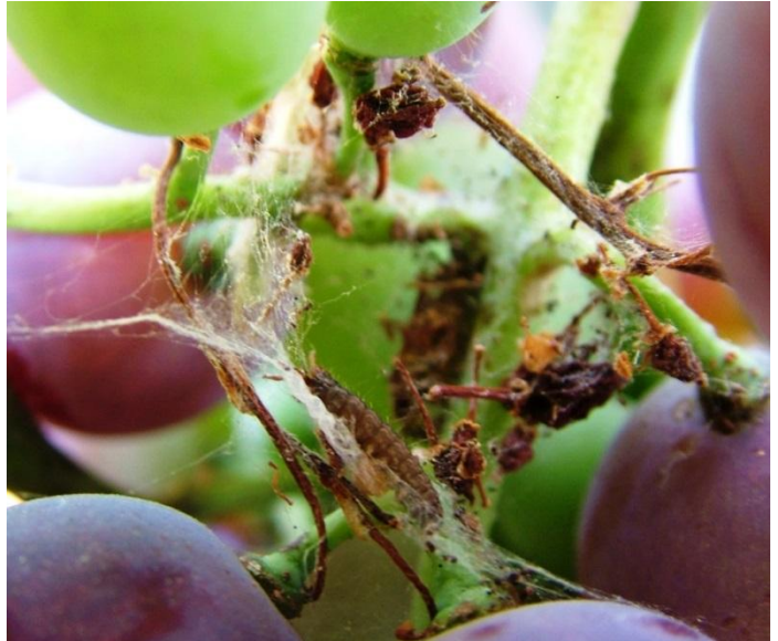
Εικόνα 2. Αυγά και προνυμφική δραστηριότητα Ευδεμίδας