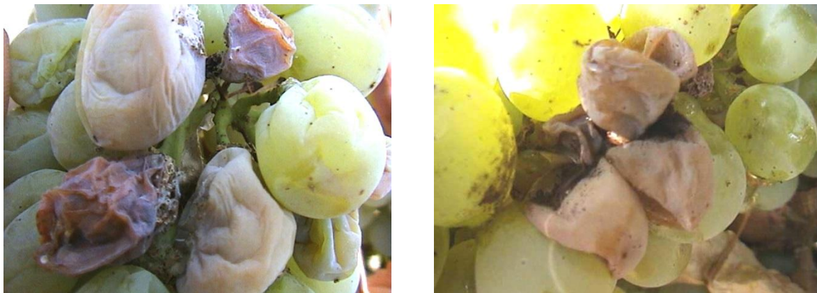
Εικόνα 1. Άμεση βλάβη των ραγών από Ευδεμίδα και έμμεση βλάβη από Βοτρίτη