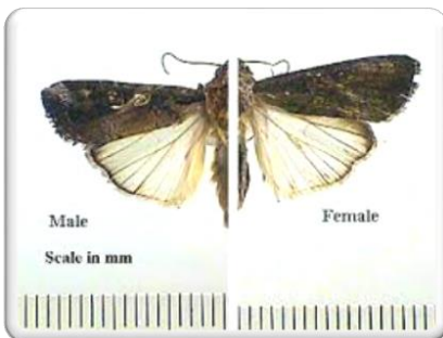
Εικ. 2 Ενήλικο έντομο [ ♂ / ♀ ]