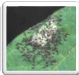
Εικ. 4 Νεαρές προνύμφες

Το καταστροφικό λεπιδόπτερο έντομο είναι εξαιρετικά πολυφάγο. Έχει καταγραφεί σε πάνω από 350 είδη φυτών ξενιστών σε περισσότερες από 75 οικογένειες. Αν και προτιμά κυρίως τα Roaceae , τα Asteraceae και τα Fabaceae προκαλεί σημαντική ζημιά στις καλλιέργειες σιτηρών , αραβοσίτου , ρυζιού , σόργου , βαμβακιού ( Gossypium spp.), σόγιας ( Glycine max ) και ζαχαροκάλαμου ( Saccharum officinarum ) σε όλο τον κόσμο. Το εύρος των ξενιστών του εκτείνεται στις πατάτες ( Solanum tuberosum ), τις ντομάτες ( Solanum lycopersicum ), τα κολοκυθάκια ( Cucurbitaceae ) και αρκετές άλλες καλλιέργειες λαχανικών και φρούτων .