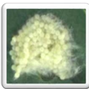
Εικ. 3 Αβγά εντόμου