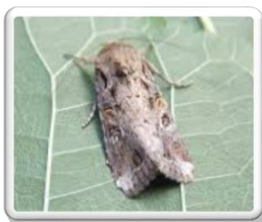
Εικ.1 Ενήλικο S. frugiperda

Σύμφωνα με τον ΕΡΡΟ, τον Ιούνιο 2019 η φυτοϋγειονομική Αρχή της Αιγύπτου στα πλαίσια των επισκοπήσεων επιβλαβών οργανισμών σε δίκτυο φερομονικών παγίδων ανακοίνωσε την πρώτη διαπίστωση της παρουσίας του Spodoptera frugiperda στην περιοχή της. Το 2020 εμφανίστηκε σε Συρία, Ιορδανία και Ισραήλ. Έπειτα στα Άδανα (Τουρκία, 2022). Τον Ιανουάριο 2023 ανακοινώθηκε η πρώτη διαπίστωση της παρουσίας του Spodoptera frugiperda στην Κύπρο ενώ πρόσφατα (καλοκαίρι 2023) επιβεβαιώθηκε η παρουσία του στη Χώρα μας στις Π.Ε. Λακωνίας, Αν. Αττικής και Λασιθίου, στο Δίκτυο Φερομονικών Παγίδων του Εθνικού Προγράμματος Επισκοπήσεων. Το έντομο Spodoptera frugiperda (Εικ. 1, 2) ανήκει στην οικογένειά Noctuidae των Λεπιδοπτέρων. Πρόκειται για ιθαγενές είδος της Αμερικής που εξαπλώθηκε ταχύτατα στην Αφρική.