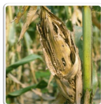
Εικόνα.5 Προσβολή σε καλλιέργειες από Spodoptera frugiperda

Το έντομο έχει μεγάλο αριθμό γενεών ανά έτος. Τα ενήλικα έχουν την ικανότητα πτήσης 100 χιλιομέτρων σε μια μόνο νύχτα. Εξαιτίας του γεγονότος ότι είναι έντομο εισβολέας δεν έχει εξειδικευμένους φυσικούς εχθρούς στις περιοχές όπου έχει εξαπλωθεί και οι πληθυσμοί του συνεχίζουν να αυξάνουν.