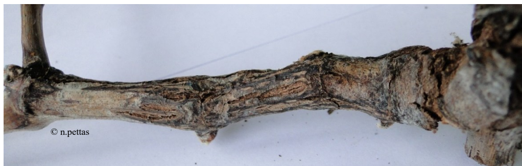
Φόμοψη ( Phomopsis viticola )