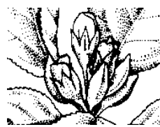
Ρόδινη (Λευκή) κορυφή