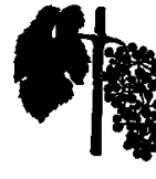
Λ. Μέγεθος μπιζελιού