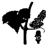
Θ. Έναρξη άνθησης

Πεδινές - πρώιμες περιοχές-πρώιμες ποικιλίες: Στάδιο Κ-Λ Ορεινές - όψιμες περιοχές-όψιμες ποικιλίες: Στάδιο Θ - Ι