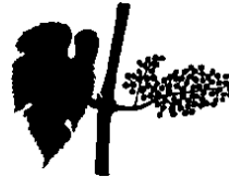
Κ. Δέσιμο ραγών