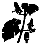
Η. Σταφύλια χωρίζουν