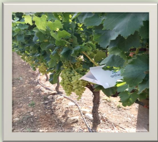
Εικόνα 1: Π.Κ.Π.Φ.Π.Φ.Ε ΚΑΒΑΛΑΣ

Από παρατηρήσεις και με βάση τα δεδομένα των συλλήψεων, το αμπέλι βρίσκεται στο στάδιο κλεισίματος των βοτρυών.