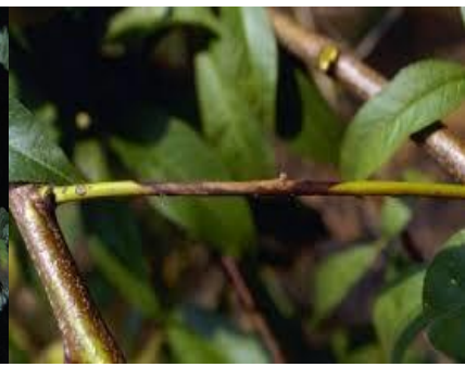
Εικ.3. Π.Κ,Π,Φ Βόλου Προσβολή

Συνεχίζεται η παρουσία της Φώμοψης phomopsis amygdali (συν. Fusicoccum amygdali ) στις Αμυγδαλιές. Προσβολές παρατηρούνται σε καλλιέργειες στους νομούς Μαγνησίας και Λάρισας.