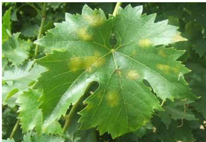
Προχωρημένη προσβολή φύλλων, όπως αυτή φαίνεται στην πάνω επιφάνεια.