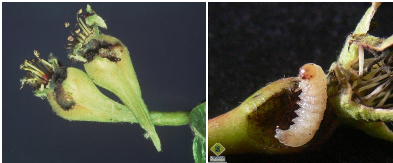
Προσβολή νεαρών αχλαδιών από προνύμφες οπλοκάμπης.

Το έντομο ωτοκεί στον κάλυκα των ανθέων και οι εκκολαπτόμενες προνύμφες ορύσσουν στοές στους αναπτυσσόμενους καρπούς, οι οποίοι πολύ σύντομα μαυρίζουν και πέφτουν. Ορισμένες χρονιές οι ζημιές που προκαλούνται από το έντομο είναι σημαντικές. Συνιστάται η διενέργεια ενός ψεκασμού με κατάλληλο και εγκεκριμένο εντομοκτόνο αμέσως μετά την άνθηση, μόνο σε οπωρώνες που παρουσίασαν προσβολή από το έντομο την προηγούμενη καλλιεργητική περίοδο.