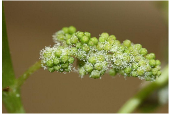
Εξανθήσεις του μύκητα στην κάτω επιφάνεια του φύλλου και σε μούρο (νεαρή ταξιανθία).