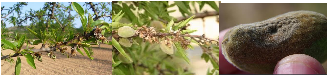
Εικόνα 1 Συμπτώματα μονιλίας σε βλαστούς και καρπό αμυγδαλιάς

Έντονες προσβολές από μονιλία διαπιστώθηκαν σε καλλιέργειες με αμυγδαλιές στα Κανάλια Μαγνησίας, στο Καλαμάκι, Συκούριο, στο Δομένικο Ελασσόνας καθώς και σε περιοχές των Νομών Καρδίτσας και Φθιώτιδας όπου καλλιεργείται η Αμυγδαλιά.