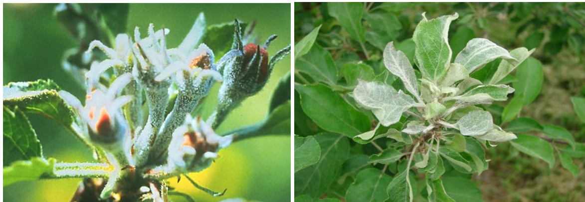
Συμπτώματα οιδίου σε νεαρή βλάστηση (ροζέτες) μηλιάς.