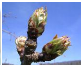
Τρυφερή βλάστηση 1,5 εκ.