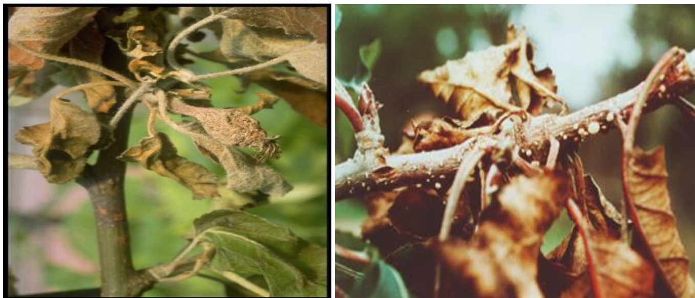
Προσβολή μονιλίας σε κλαδίσκους μηλιάς.

Επισημαίνεται, ότι η καταπολέμηση της ασθένειας είναι δυνατό να συνδυαστεί με εκείνη για τα φουζικλάδια.