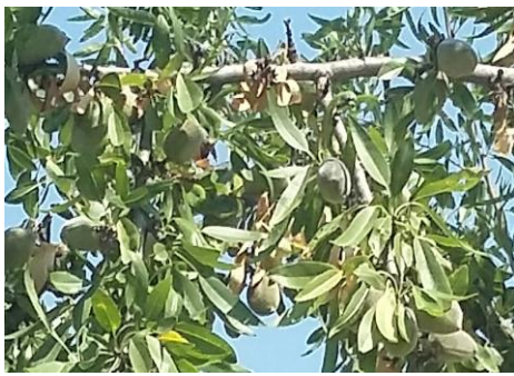
Εικ.1 Π.Κ,Π,Φ Βόλο από Fusicoccum amygdali