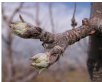
Βλάστηση 1,5 εκ