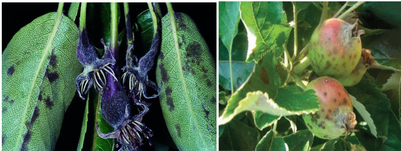
Συμπτώματα φουζικλαδίων σε φύλλα, άνθη & καρπούς αχλαδιάς & μηλιάς

Επισημαίνεται ότι: 1) οι παραπάνω ψεκασμοί είναι ιδιαίτερα σημαντικοί, διότι περιορίζουν σημαντικά τον κίνδυνο μελλοντικών μολύνσεων, 2) εγκεκριμένα χαλκούχα σκευάσματα μπορούν με ασφάλεια να χρησιμοποιηθούν μόνο στους δύο πρώτους ψεκασμούς, 3) σε περίπτωση που επικρατούν βροχοπτώσεις κατά την περίοδο της καρπόδεσης και της ανάπτυξης των νεαρών καρπών και ανάλογα πάντα με το ιστορικό προσβολής του οπωρώνα, συστήνεται η συνέχιση των ψεκασμών όσο διαρκεί η βροχερή περίοδος και ανάλογα με τη διάρκεια δράσης των μυκητοκτόνων, 4) για την αποφυγή ανάπτυξης ανθεκτικότητας των μυκήτων συνιστάται η εναλλαγή μυκητοκτόνων από διαφορετικές χημικές ομάδες, 5) ενθαρρύνεται η χρήση των εγκεκριμένων μικροβιακών σκευασμάτων.