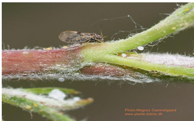
Προσβολή ψύλλας σε τρυφερή βλάστηση αχλαδιάς.