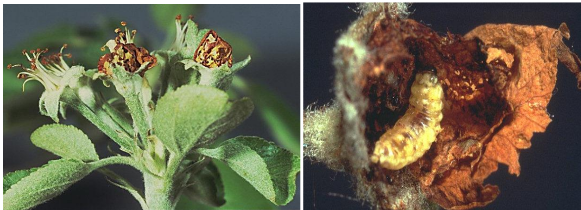
Προσβολή ανθέων μηλιάς από προνύμφες ανθονόμου.

Το έντομο γεννά τα αυγά του μέσα στα κλειστά άνθη της μηλιάς. Οι προνύμφες καταστρέφουν τα αναπαραγωγικά όργανα, με αποτέλεσμα τα άνθη να παραμένουν κλειστά και να ξεραίνονται. Συνιστάται ένας ψεκασμός με κατάλληλο και εγκεκριμένο εντομοκτόνο στο διάστημα μεταξύ πράσινης κορυφής και έναρξης της άνθησης, μόνο σε οπωρώνες που την προηγούμενη καλλιεργητική περίοδο παρατηρήθηκε σοβαρή προσβολή από το έντομο.