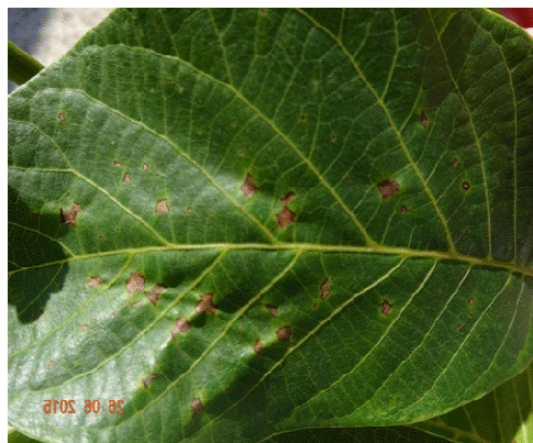
Προσβολή καρπών και φύλλων από ανθράκωση