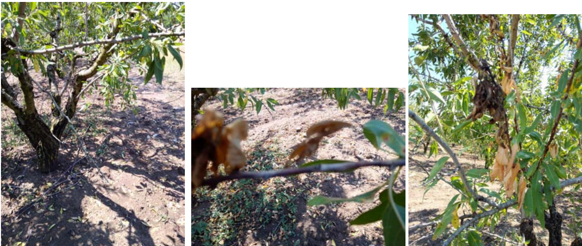
Εικ2. Π.Κ.Π.Φ.Π. & Φ.Ε. Βόλου Προσβολή από Fusicoccum amygdali

Ενεργός παραμένει ο παθογόνος μύκητας της Φώμοψης phomopsis amygdali (συν. Fusicoccum amygdali ) στις Αμυγδαλιές.