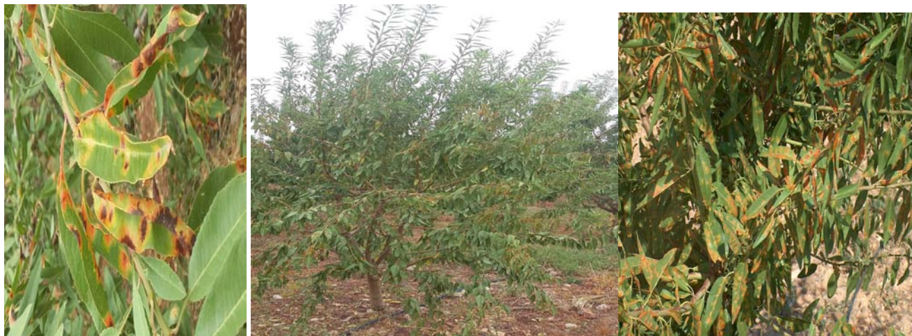
Εικ.4 5.6 ΠΚΠ.Φ Βόλου Προσβολή από ΠΟΛΥΣΤΙΓΜΩΣΗ ( Polystigma ochraceum )

Συνεχίζεται η εμφάνιση της η πολυστίγμωση μετά τις πρώτες βροχοπτώσεις με έντονες προσβολές σε Αμυγδαλέωνες της επαρχίας Ελασσόνας Δομένικο, καθώς και σε άλλες περιοχές του Ν.Λαρίσας Ν. Μαγνησίας ,και Ν.Φθιώτιδας.