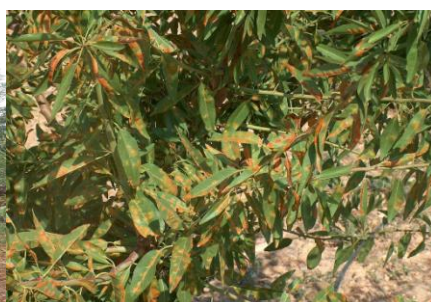
Εικ.4 5.6 ΠΚΠ.Φ Βόλου Προσβολή από ΠΟΛΥΣΤΙΓΜΩΣΗ ( Polystigma ochraceum )

Συνεχίζεται η παρουσία της πολυστίγμωσης σε Αμυγδαλεώνες στους Νομούς Μαγνησίας Λάρισας, Καρδίτσας και Φθιώτιδας.