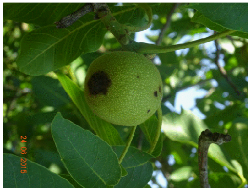
Προσβολή καρπών από βακτηρίωση