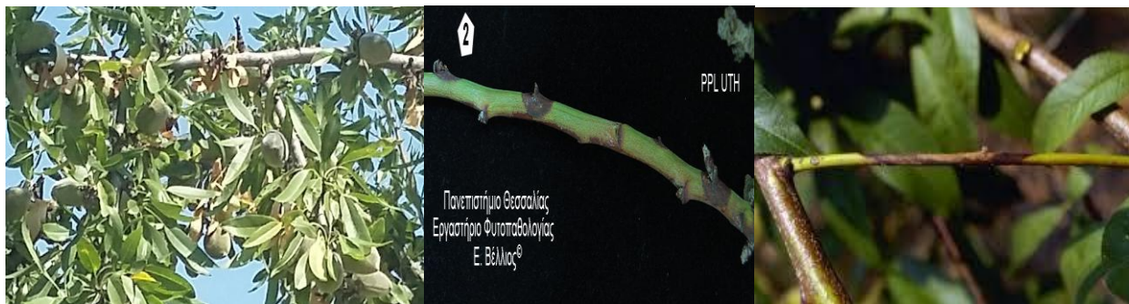
Εικ.1 Π.Κ,Π,Φ Βόλο

Phomopsis amygdali (συν. Fusicoccum amygdali )