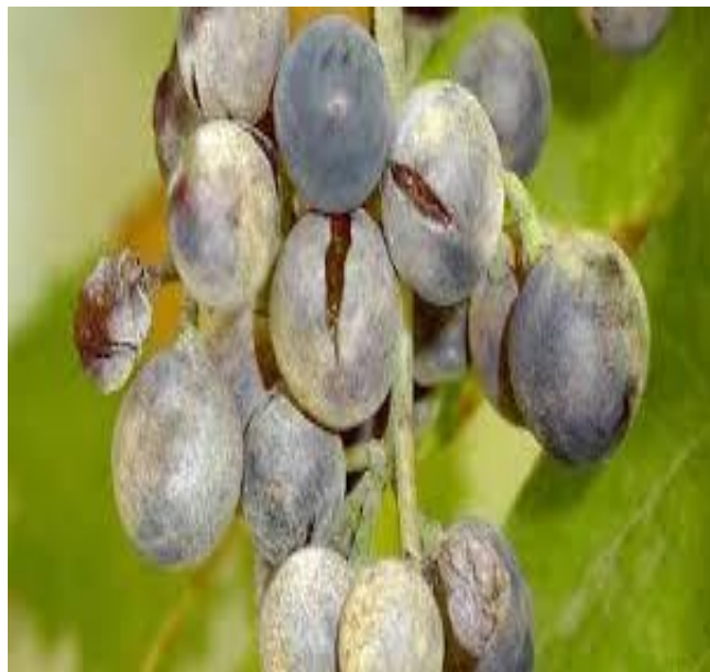
Προσβολή ωιδίου σε σταφύλι.