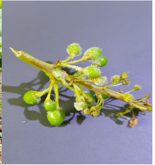
Προσβολή περonosπόρου σε βότρυες και κονιδιοφόροι του μύκητα.