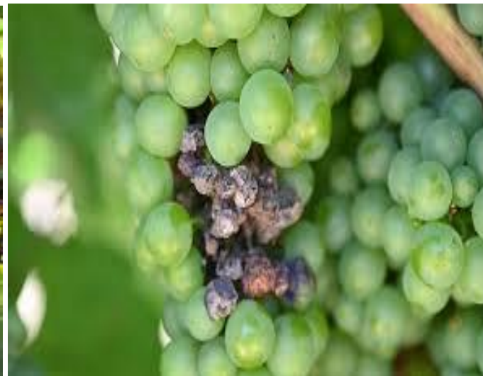
Προσβολή βοτρύτη σε σταφύλια και γκρίζου χρώματος καρποφορίες του μύκητα