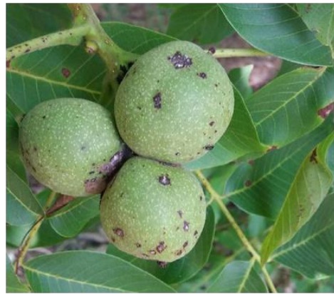
Εικ. 11. Προσβολή καρπού