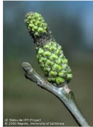
Εικ. 1 & 2. Προσβολή ιούλων