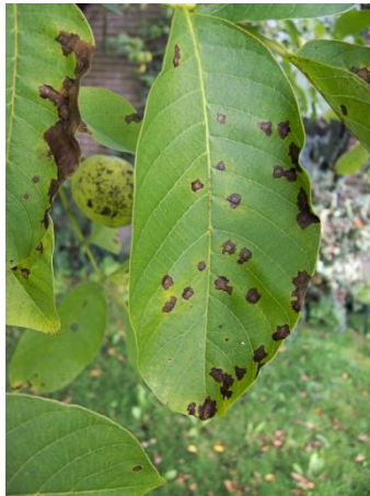
Εικ. 10. Προσβολή φύλλου