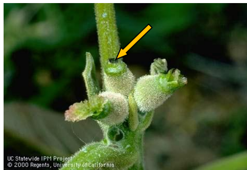
Εικ. 3. Προσβολή θηλυκού άνθους