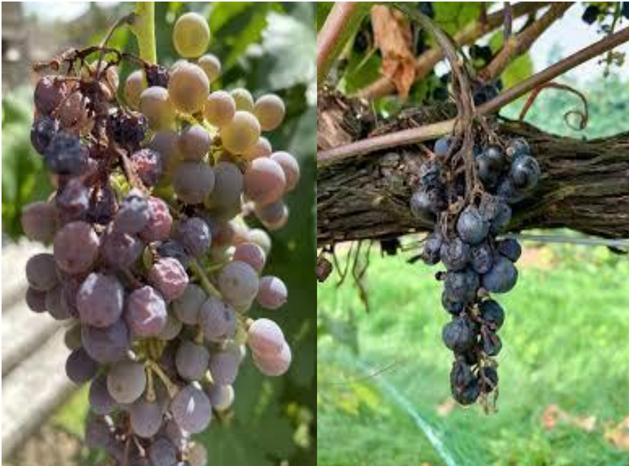
Σύμπτωμα ξήρανσης ράχης σε σταφύλια.

Είναι σημαντικό να γίνεται πλήρης διαβροχή των σταφυλιών με το ψεκαστικό υγρό.