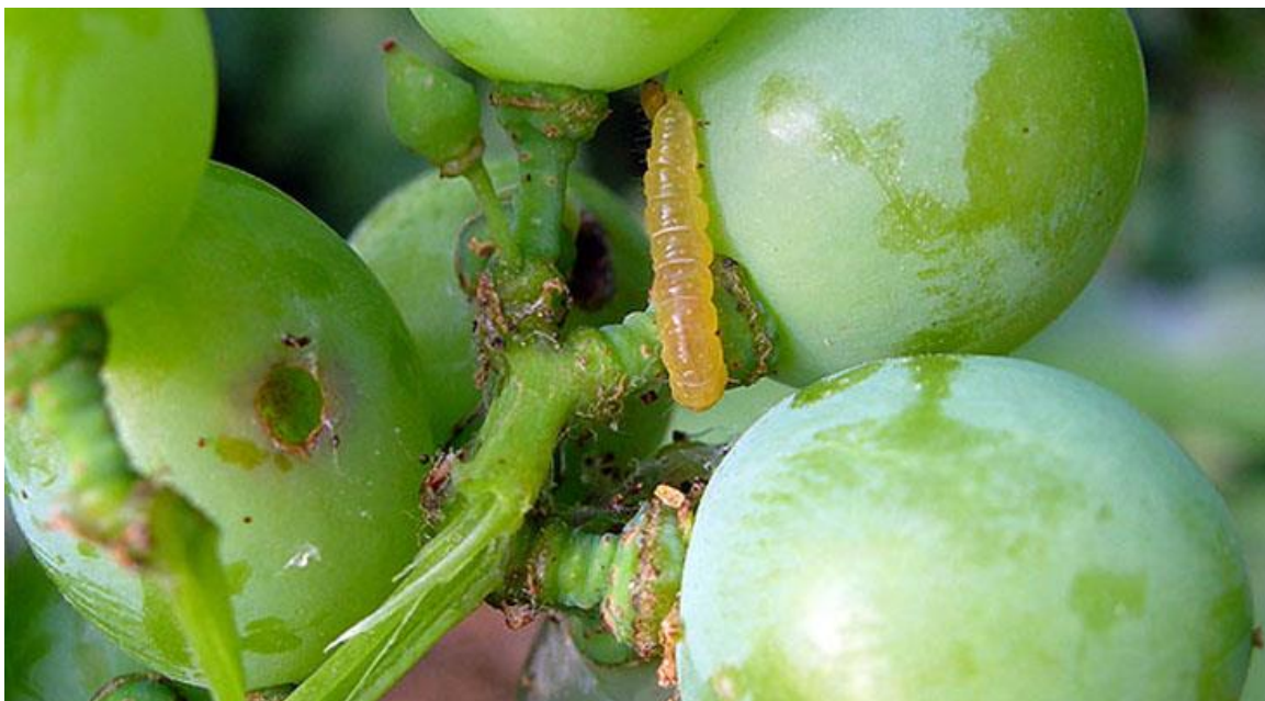
Προσβολή και προνύμφη ευδεμίδας σε σταφύλι.

Το σωστό ξεφύλλισμα βοηθά στην πλήρη και αποτελεσματική διαβροχή των σταφυλιών με το ψεκαστικό υγρό.