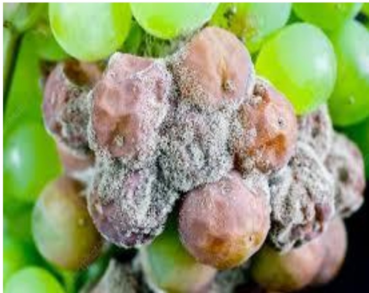
Προσβολή βοτρύτη σε σταφύλια.