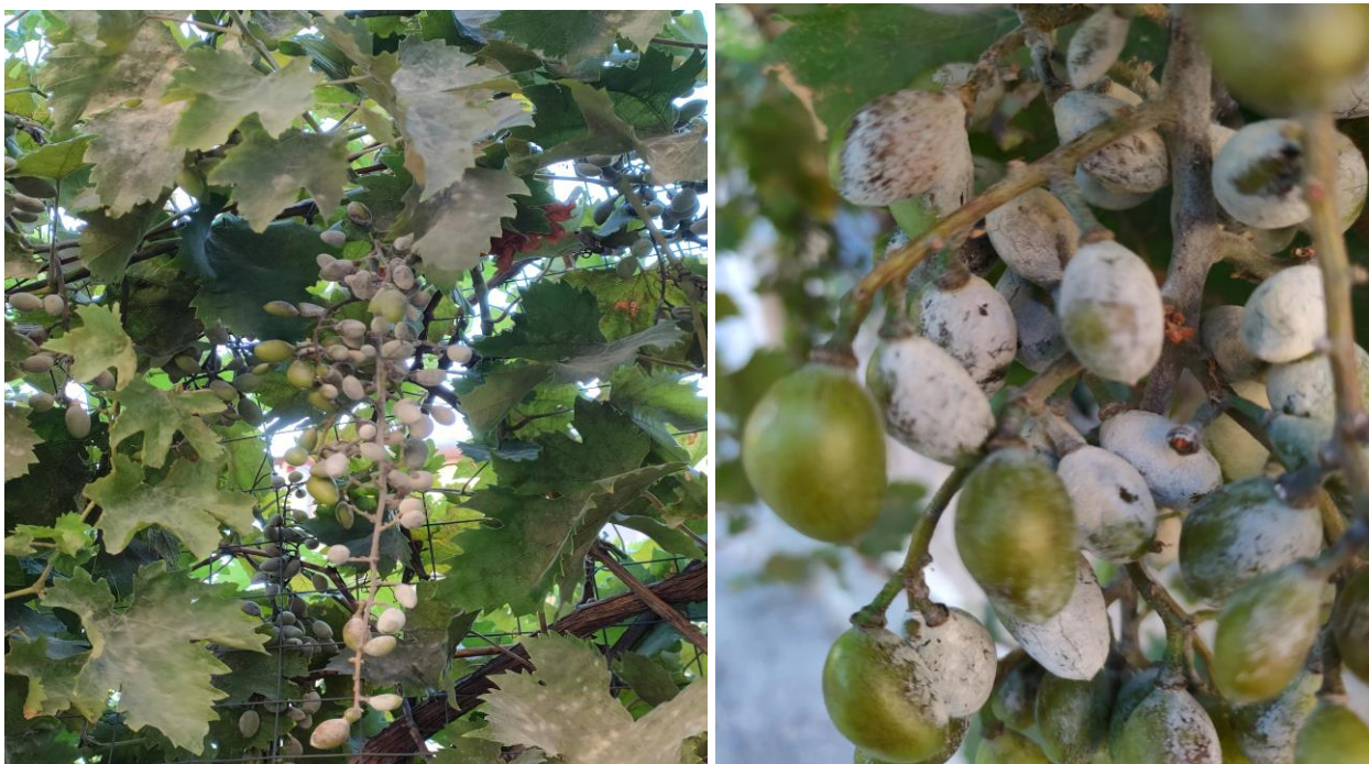
Ισχυρή προσβολή ωιδίου σε σταφύλια και φύλλωμα

Συνιστάται η συνέχιση της προστασίας των σταφυλιών από το ωίδιο, μέχρι τουλάχιστον και το στάδιο του “γυαλισματος” των ραγών. Να προσεχθούν ιδιαίτερα τα αμπέλια που βρίσκονται σε περιοχές, στις οποίες η ασθένεια ενδημεί, καθώς επίσης και οι ευαίσθητες ποικιλίες. Επισημαίνεται ότι η καταπολέμηση του ωιδίου είναι κυρίως προληπτική, δεδομένου ότι η αντιμετώπιση της ασθένειας στην περίπτωση που έχουν εκδηλωθεί προσβολές από το παθογόνο, είναι εξαιρετικά δύσκολη και όχι πάντα αποτελεσματική.