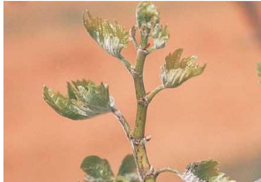
Νεαροί βλαστοί με έντονη προσβολή από ωίδιο ( Uncinula necator )