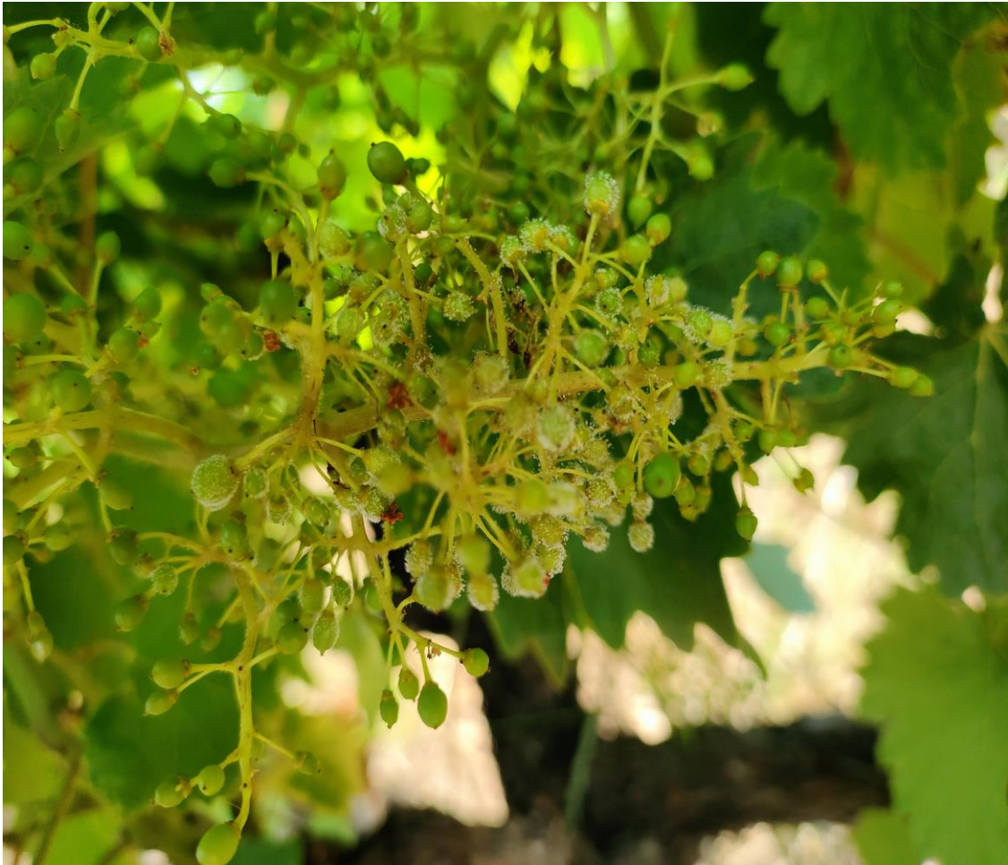
Προσβολή βότρυος από περονόσπορο.