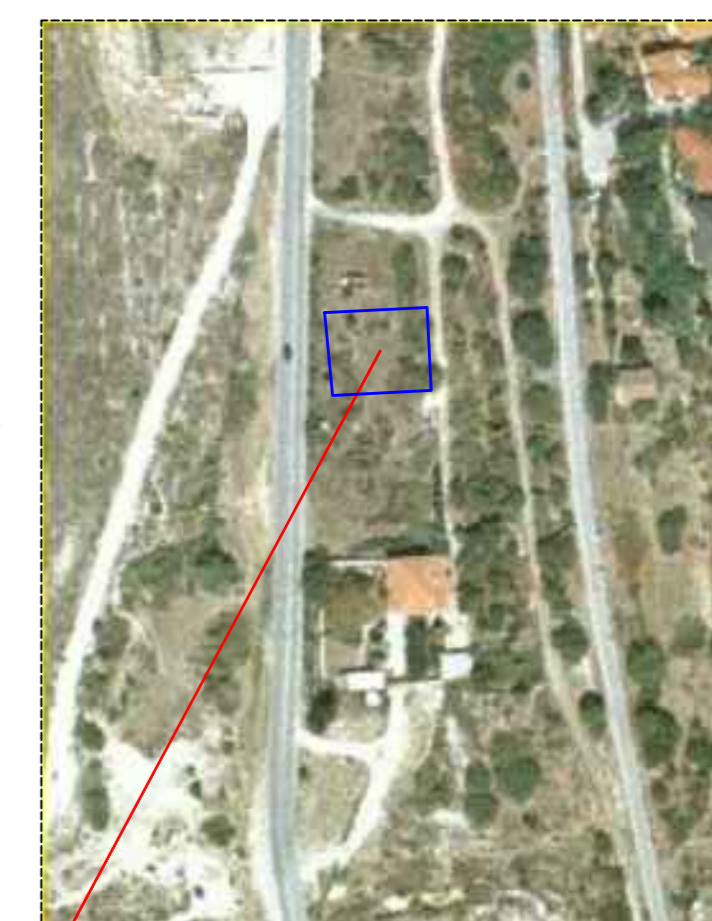
ΘΕΣΗ ΟΙΚΟΠΕΔΟΥ ΠΡΟΣ ΜΙΣΘΩΣΗ

Δηλώνω υπεύθυνα ότι το παρον οικόπεδο με (Α,Β,Γ,Δ -Α) που βρίσκεται εντός του αρχικού οικισμού Άρνισσας Δ Έδεσσας Ν Πέλλας , αποτελεί διανομή και έχει εμβαδον Ε(Α,Β,Γ,Δ -Α) = 584.78τ.μ. Το παραπάνω οικόπεδο είναι ΑΡΤΙΟ και ΟΙΚΟΔΟΜΩΣΙΜΟ σύμφωνα με τις ισχύουσες Πολεοδομικές Διατάξεις. Δεν αντικείται στον Ν. 651/77 κ δεν υπαγεται στις διατάξεις του Ν. 1337/83. Τα όμορα προς αυτό οικόπεδα είναι επίσης ΑΡΤΙΑ και ΟΙΚΟΔΟΜΩΣΙΜΑ σύμφωνα με τις ισχύουσες Πολεοδομικές Διατάξεις. Η ΜΗΧΑΝΙΚΟΣ