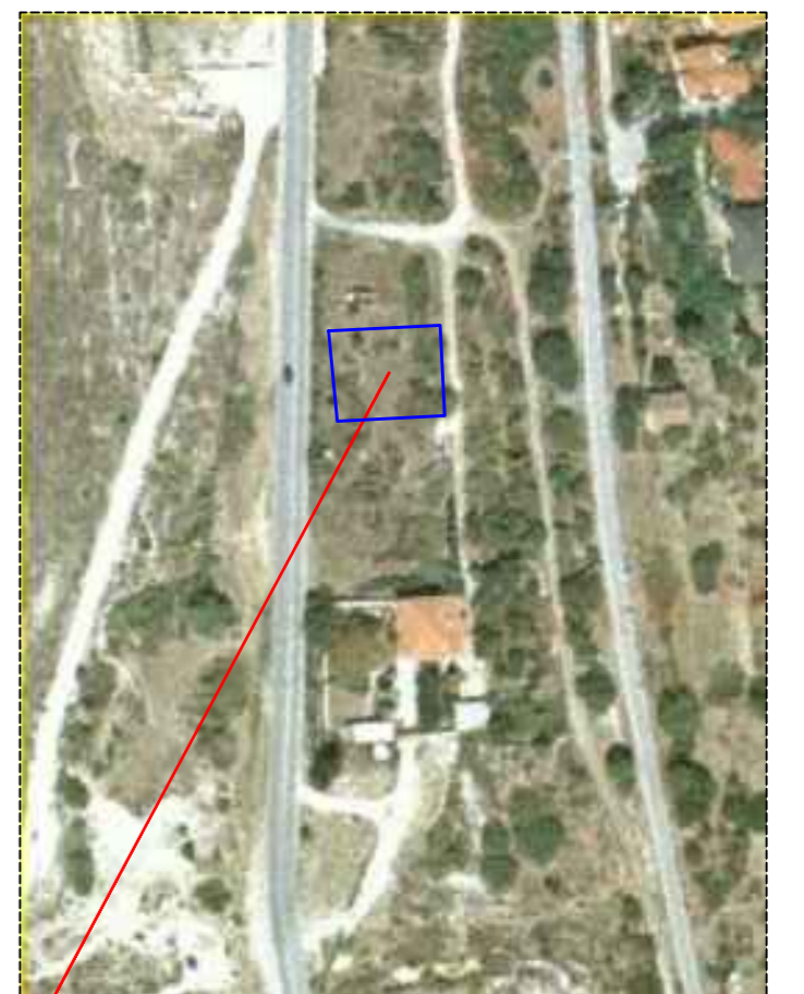
ΘΕΣΗ ΟΙΚΟΠΕΔΟΥ ΠΡΟΣ ΜΙΣΘΩΣΗ