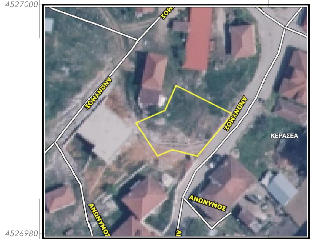
Απόσπασμα ορθοφωτοχάρτη.