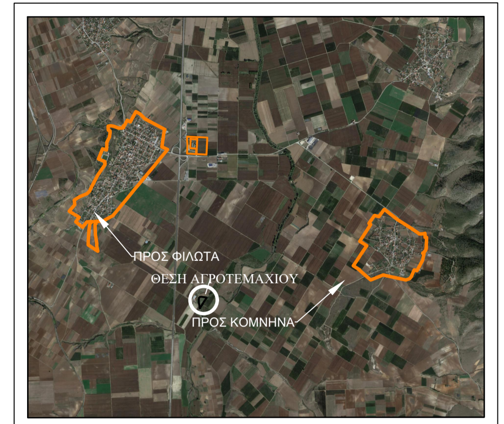
ΟΔΟΠΟΡΙΚΟ ΔΙΑΓΡΑΜΜΑ - ΔΟΥΦΟΡΙΚΕΣ ΕΙΚΟΝΕΣ GOOGLE EARTH

ΔΗΛΩΣΗ ΜΗΧΑΝΙΚΟΥ (N .651/77) Δηλώνω σύμφωνα με το νόμο για το γεωτεμάχιο με στοιχεία : "0-1-2...17-18-0" και εμβαδόν E= 9374.58 τμ. σύμφωνα με το Γεωμετρικό Σχήμα του Χάρτη Αναδάσμου του Πελαργού Φλωρίνης Έτους 1979-1981 με αριθμό τεμαχίου 422 που βρίσκεται εκτός σχεδίου και εκτός ορίων οικισμού Πελαργού, στην Τ.Κ. Πελαργού, Δήμου Αμυνταίου, Π.Ε. Φλώρινας, Περιφέρειας Δυτικής Μακεδονίας, ότι: α) Είναι άρτιο και είναι οικοδομήσιμο σύμφωνα με τις πολεοδομικές διατάξεις που ισχύουν σήμερα. β) Βρίσκεται εκτός σχεδίου, εκτός ορίων οικισμού και εκτός ΖΟΕ. γ) Δεν εμπίπτει στις διατάξεις του Ν.1337/1983 περί εισφορών σε γή και χρήμα. δ) Εντός αυτού δεν διέρχονται εναέριες γραμμές μεταφοράς υψηλής τάσης της ΔΕΗ και αγωγός φυσικού αερίου. ε) Εντός αυτού και κατά μήκος του προσώπου του εν θέματι γεωτεμαχίου δεν υπάρχουν δέντρα ζ) Το γήπεδο δεν είναι ενταγμένο σε περιοχή που έχει αναρτηθεί στο Εθνικό Κτηματολόγιο. ΠΑΡΑΤΗΡΗΣΕΙΣ: 1) Το διάγραμμα είναι ενταγμένο στο κρατικό σύστημα συντεταγμένων ΕΓΣΑ '87 2) Οι διαστάσεις των πλευρών και το εμβαδόν του γεωτεμαχίου υπολογίσθηκαν από τις συντεταγμένες των κορυφών. 3) Η εξάρτηση από το ΕΓΣΑ '87 πραγματοποιήθηκε με σύστημα GPS και κάνοντας χρήση του Ελληνικού Συστήματος Εντοπισμού - HEPOS. Ο ΜΗΧΑΝΙΚΟΣ ΣΤΑΥΡΟΣ ΜΠΙΤΑΚΗΣ ΠΟΛΙΤΙΚΟΣ ΜΗΧΑΝΙΚΟΣ