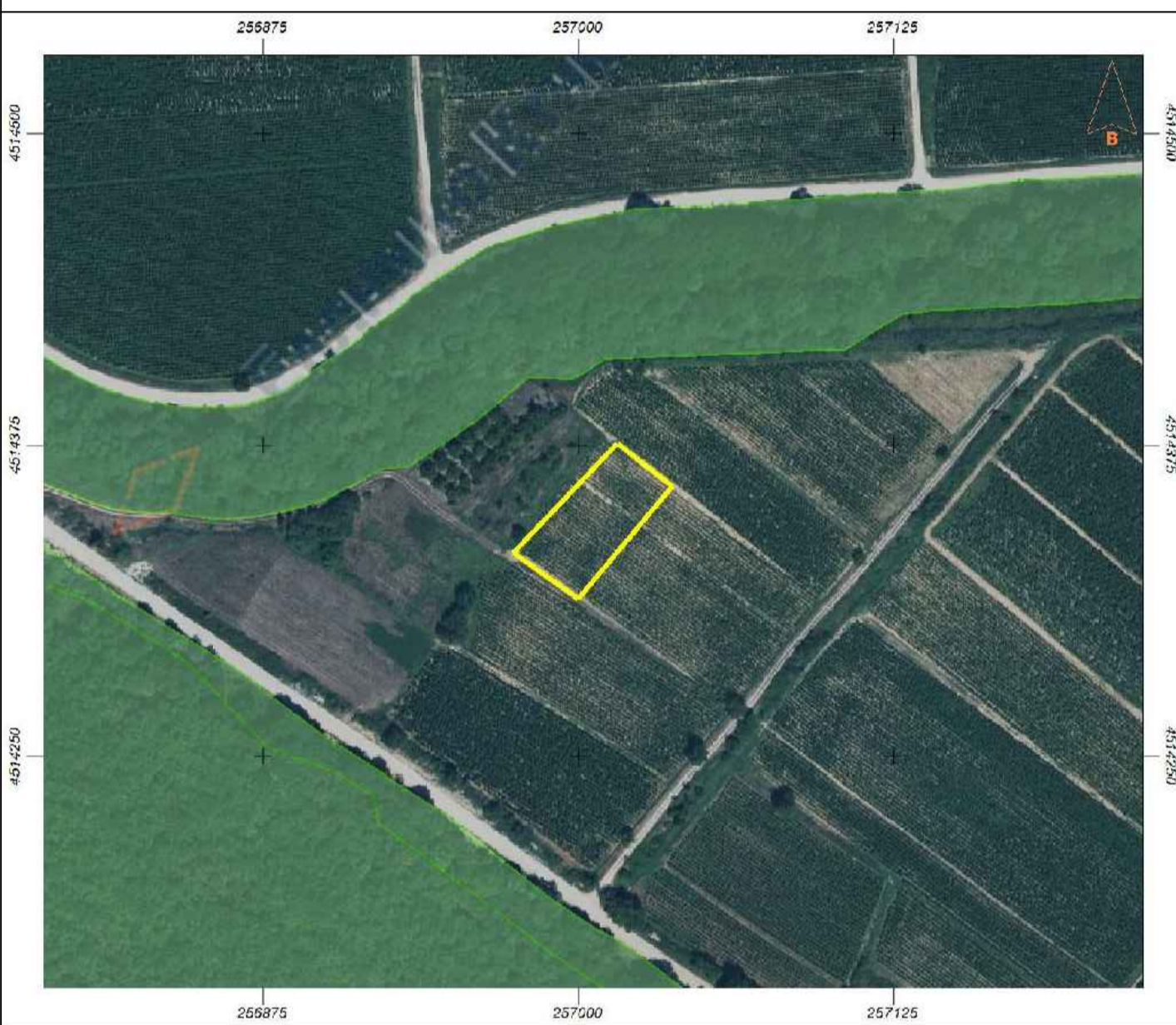
ΑΠΟΣΠΑΣΜΑ ΧΑΡΤΗ ΑΝΑΔΑΣΜΟΥ ΕΤΟΥΣ 1974 ΑΓΡΟΚΤΗΜΑΤΟΣ "ΜΙΚΡΟΛΙΜΝΗΣ" ΚΛΙΜΑΚΑ 1:5000

ΑΠΟΣΠΑΣΜΑ ΔΑΣΙΚΟΥ ΟΡΘΟΦΩΤΟΧΑΡΤΗ ΕΤΟΥΣ 2015-2016 ΚΛΙΜΑΚΑ 1:2500