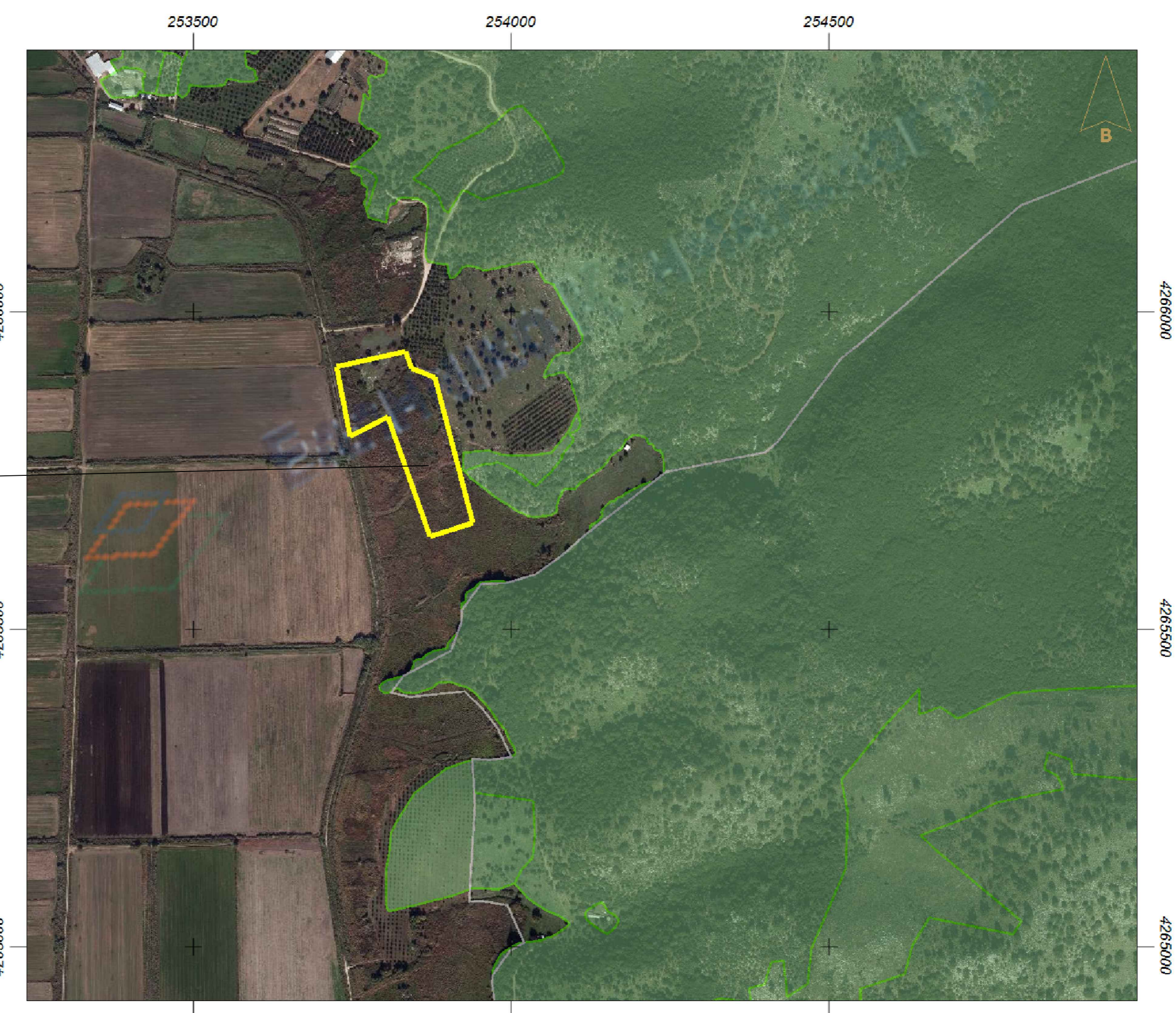
ΑΠΟΣΠΑΣΜΑ ΔΑΣΙΚΟΥ ΧΑΡΤΗ