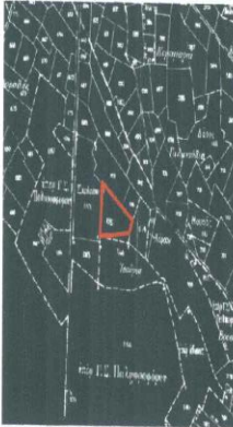
ΑΠΟΣΠΑΣΜΑ Γ.Π.Σ. ΔΗΜΟΥ ΛΟΥΡΟΥ.