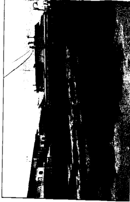
ΦΩΤΟΓΡΑΦΙΑ ΑΠΟ ΘΕΣΗ ΛΗΨΗΣ 1