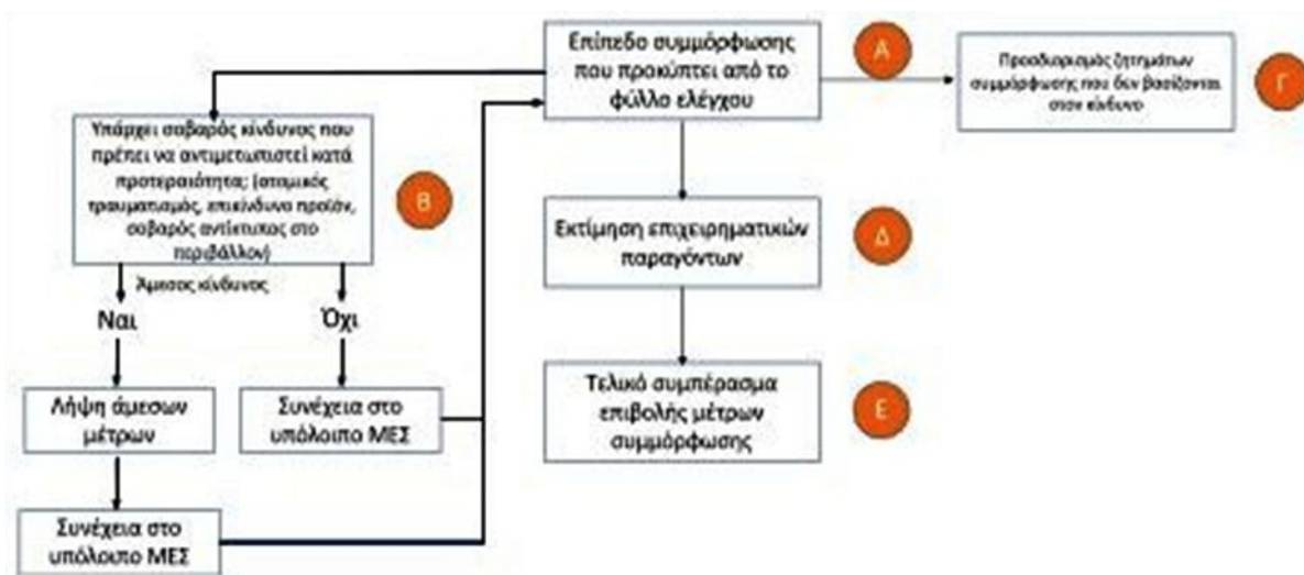
Διάγραμμα 1: Διαδικασία Μοντέλου Ενεργειών Συμμόρφωσης

Βάσει του παραπάνω διαγράμματος, ο ελεγκτής καθοδηγείται με συγκεκριμένο τρόπο στις κατάλληλες ενέργειες συμμόρφωσης, βάσει ρίσκου σύμφωνα με τις απαιτήσεις του ν.4512/2018.