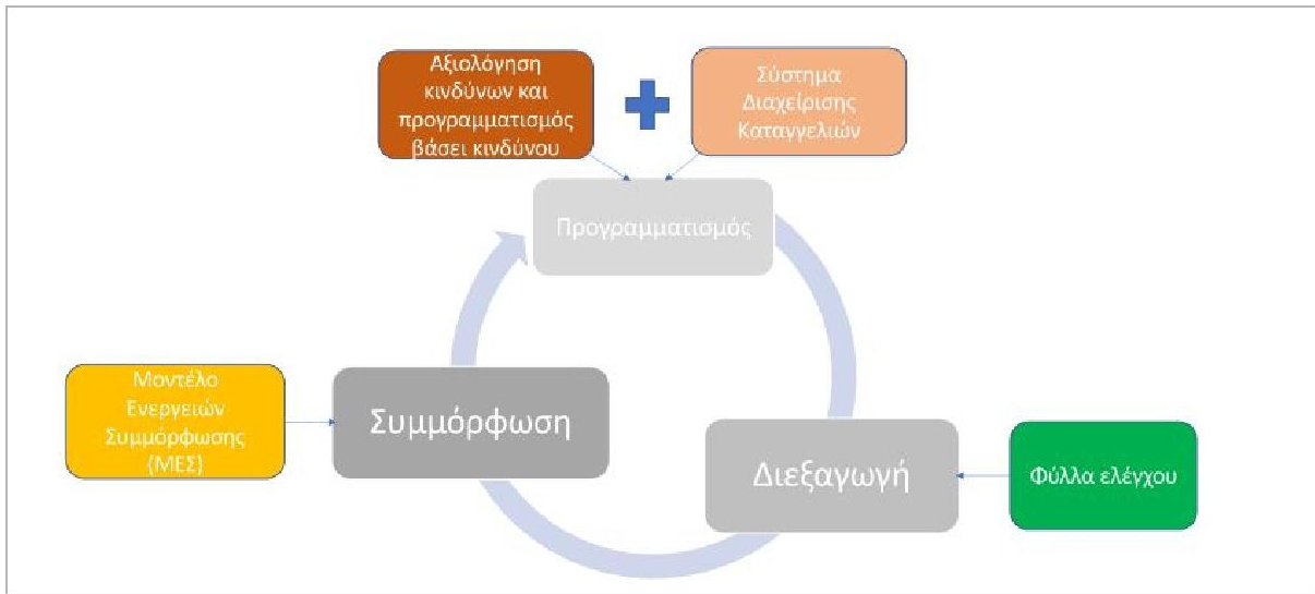
Εικόνα 1: ΜΕΣ και Κύκλος Εποπτείας

Για πληρέστερη κατανόηση στην παρακάτω εικόνα 1 απεικονίζεται η θέση του ΜΕΣ στον κύκλο εποπτείας: