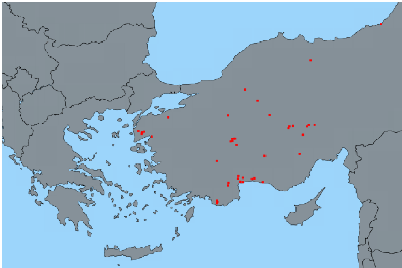
Εικόνα 2: Εστίες Πανώλης των Μικρών Μηρυκαστικών (01/10/2015 - 2/2/2016)