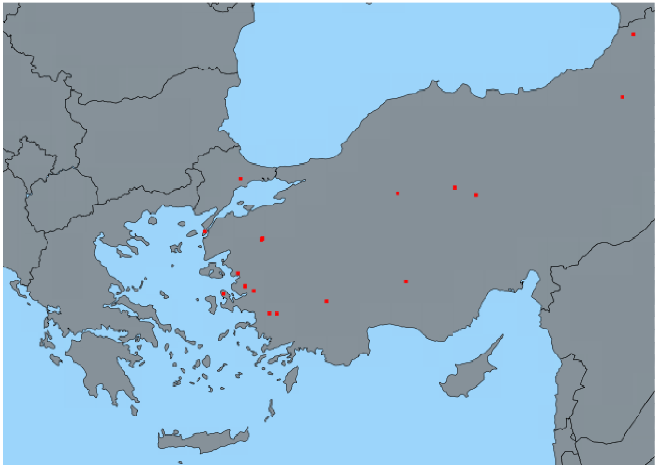
Εικόνα 1: Εστίες Ευλογιάς (1/10/2015-2/2/2016)