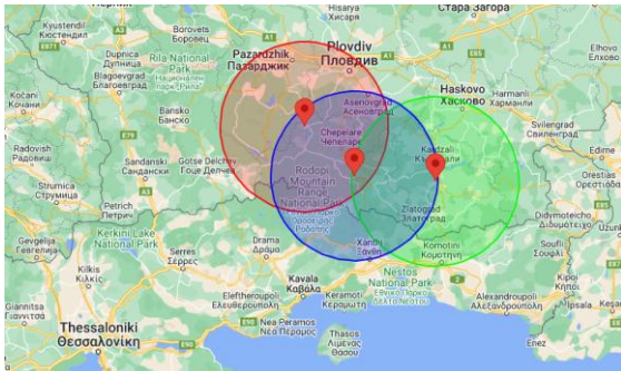
Εικόνα 2 Εστίες ΑΠΧ στη Βουλγαρία και ζώνη ακτίνας 50χλμ

Επιπλέον σας γνωρίζουμε ότι στις 16 Ιανουαρίου 2024 μέσω του συστήματος ADIS της Ευρωπαϊκής Επιτροπής κοινοποιήθηκαν, μεταξύ άλλων, επτά (7) δευτερογενείς εστίες Αφρικανικής Πανώλης των Χοίρων (ΑΠΧ) σε αγριόχοιρους στη Βουλγαρία στην περιοχή Haskovo (1), Kardzhali (1) και Smolyan (5) σε κοντινή απόσταση από τα ελληνοβουλγαρικά σύνορα (Εικ. 2, 3).