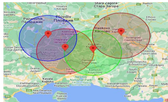
Εικόνα 3 Εστίες ΑΠΧ στη Βουλγαρία και ζώνη ακτίνας 50χλμ

Στη Βουλγαρία έχουν εντοπισθεί από 01.01.2024 έως 16.01.2024, ενενήντα έξι (96) εστίες σε αγριόχοιρους οι οποίες αφορούν σε θηρευμένους αγριόχοιρους στο πλαίσιο γενικής επιτήρησης του νοσήματος στην χώρα αυτή.