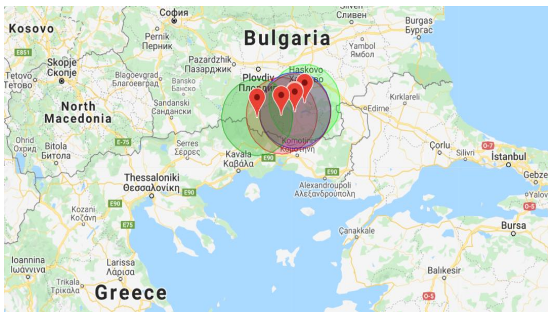
Εικόνα 1. Εστίες ΑΠΧ σε στη Βουλγαρία και ζώνη ακτίνας 50 χλμ

Σας ενημερώνουμε ότι στις 9 Φεβρουαρίου 2022 μέσω του συστήματος ADIS της Ευρωπαϊκής Επιτροπής κοινοποιήθηκαν, μεταξύ άλλων, δέκα (10) δευτερογενείς εστίες Αφρικανικής Πανώλους των Χοίρων (ΑΠΧ) σε αγριόχοιρους στην Βουλγαρία στις περιοχές Kardzhali (5 εστίες), Smolyan (4 εστίες) και Plovdiv (1 εστία) σε κοντινή απόσταση από τα ελληνοβουλγαρικά σύνορα (βλέπε Εικ. 1,2).