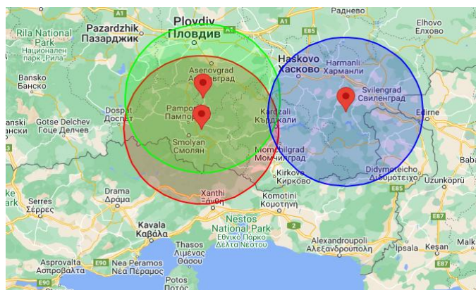
Εικόνα 3. Εστίες ΑΠΧ στη Βουλγαρία και ζώνη ακτίνας 50 χλμ.