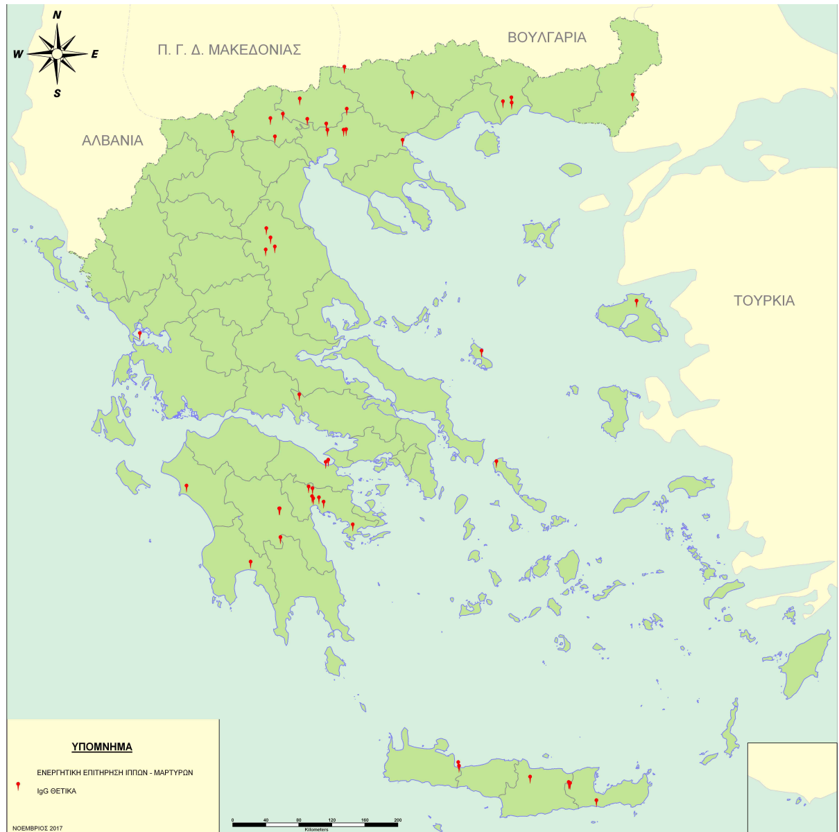
Χάρτης 2: περιοχές όπου ανιχνεύθηκαν αντισώματα IgG κατά του ιού του Δυτικού Νείλου σε ιπποειδή

Αναφορικά με την κατάσταση της νόσου στον άνθρωπο, μπορείτε να ενημερώνεστε από την επίσημη ιστοσελίδα του Κέντρου Ελέγχου και Πρόληψης Νοσημάτων (ΚΕΕΛΠΝΟ).