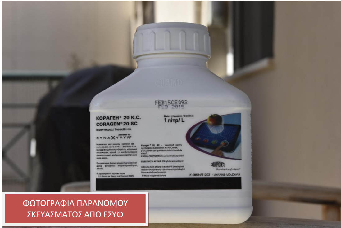
ΦΩΤΟΓΡΑΦΙΑ ΠΑΡΑΝΟΜΟΥ ΣΚΕΥΑΣΜΑΤΟΣ ΑΠΟ ΕΣΥΦ