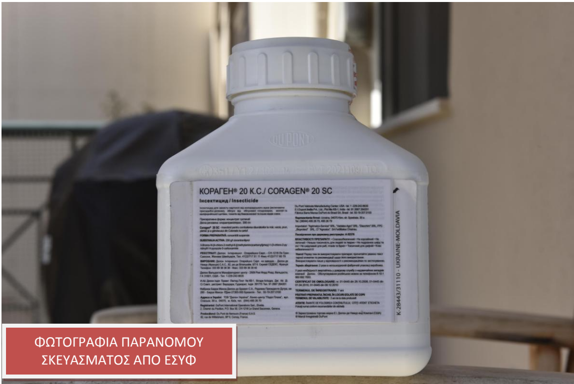
ΦΩΤΟΓΡΑΦΙΑ ΠΑΡΑΝΟΜΟΥ ΣΚΕΥΑΣΜΑΤΟΣ ΑΠΟ ΕΣΥΦ