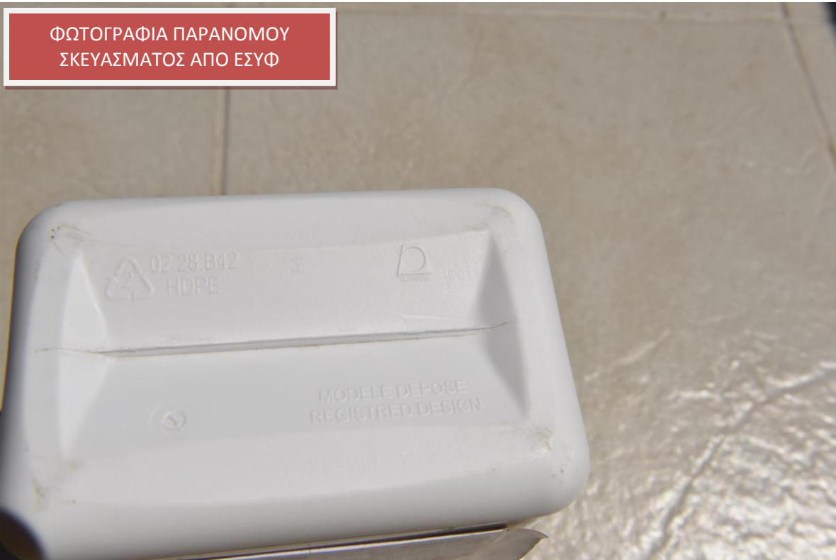
ΦΩΤΟΓΡΑΦΙΑ ΠΑΡΑΝΟΜΟΥ ΣΚΕΥΑΣΜΑΤΟΣ ΑΠΟ ΕΣΥΦ